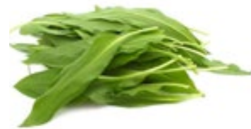
Bärlauch im Bund