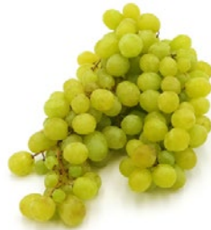
helle kernlose Trauben